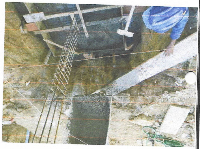
Lançamento com uso de baldes, adensamento e acabamento de concreto em estruturas.