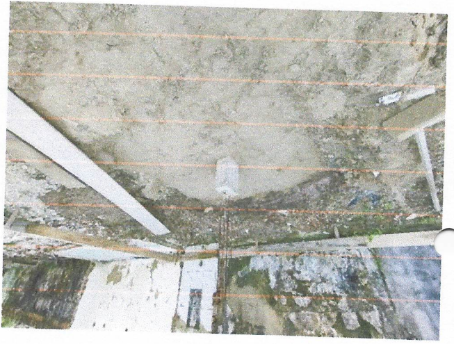
Aterro Manual do Solo e compactação Mecanizada