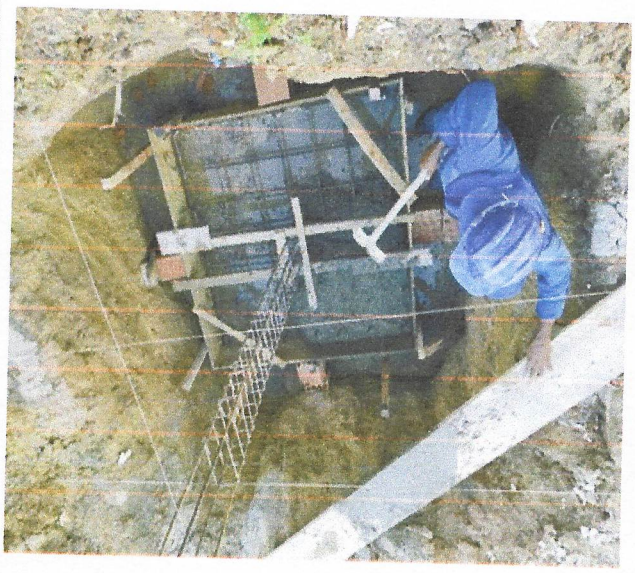
Armargão de bloco, viga baldrame e sapata utilizando Aço Ca-60 de 5 Mm-Montagem.