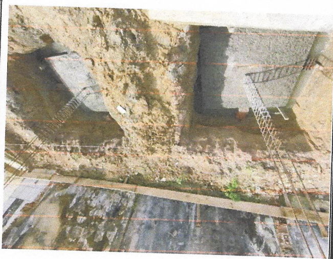
Armação de pilar, utilizando Aço Ca-50 de 10,0 Mm-Montagem.