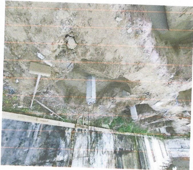
Escavação manual de vala para Viga Baldrame