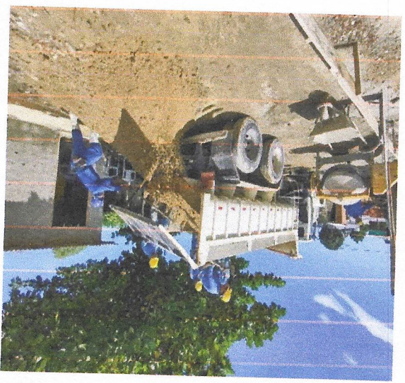
Argila (Retirada na jazida, sem transporte)