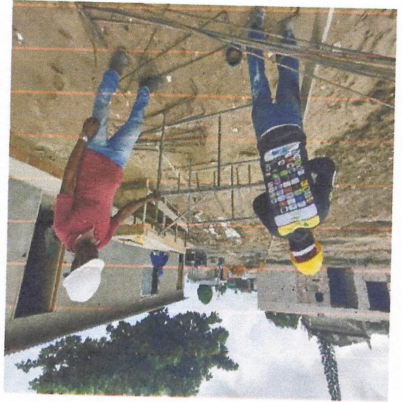
Armargão de Bloco