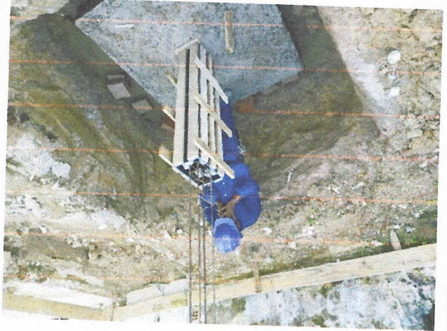
Montagem e desmontagem de forma de pilares retangulares e estruturas similares.