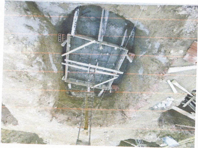
Armação de pilar-utilizando Aço Ca-60 de 5,0 Mm-Montagem.