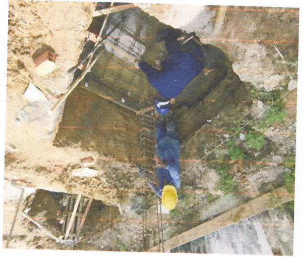
Armargão de bloco, aço Ca-50 de 10 Mm.