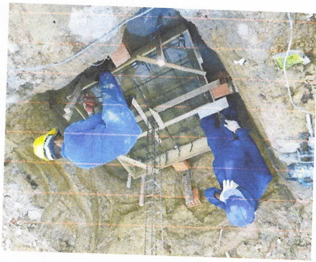
Fabricação, montagem e desmontagem de forma pra sapata, em madeira serrada.