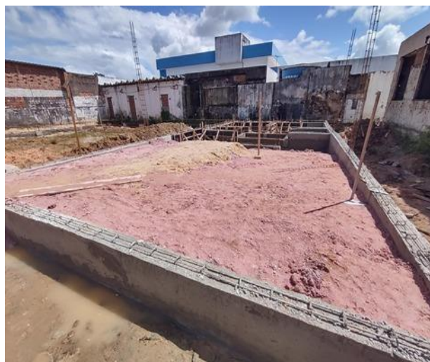
Aterro Manual do Solo e compactação Mecanizada