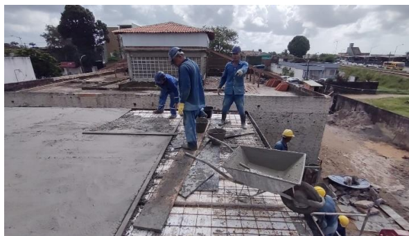
Concretagem da laje.