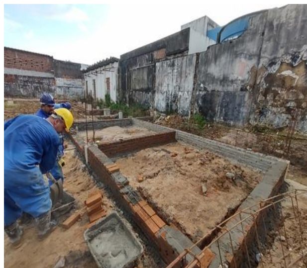
Alvenaria de Embasamento em tijolos cerâmicos macios