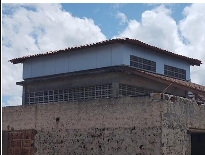
Revestimento ACM para fachadas, inclusive pintura e estrutura de fixação.