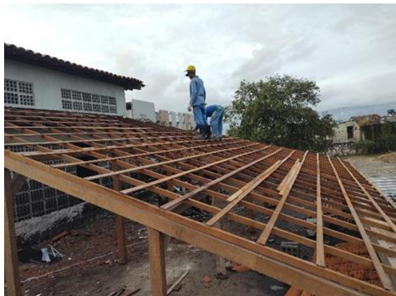
Trama de Madeira Composta por ripas, caibros e terças para telhados de telha cerâmica.