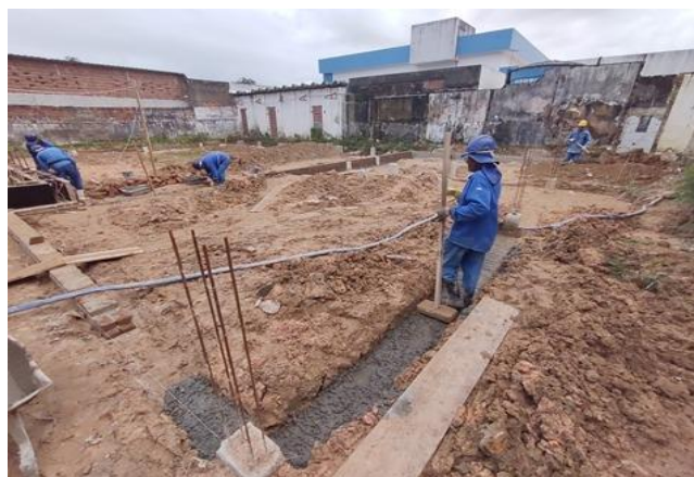
Lastro de Concreto Magro-Cintas do Foyer