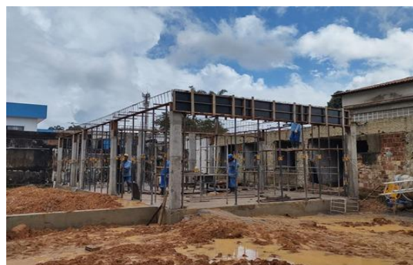
Montagem e Desmontagem de fôrma de viga, escoramento metálico, pé-direito simples, em chapa de madeira resinada.