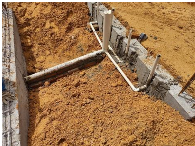
Caixa Sifonada ,Pvc ,Dn 100x100x50Mn, fornecida e instalada em ramais de encaminhamento de água pluvial.