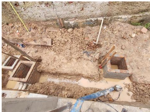
Caixa de gordura 50x50cm com tampa e fundo em concreto.