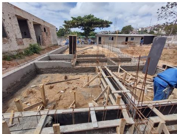
Armação de bloco, viga baldrame ou sapata utilizando Aço Ca-50 de 10 Mm-Montagem.