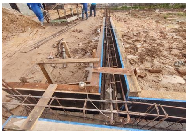
Fabricação, montagem e desmontagem de fôrma para vigas baldrame, em madeira-Cintas do foyer