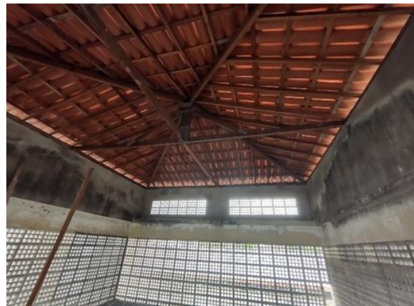
Telhado com telha cerâmica Capa-Canal, tipo colonial, com mais de 2 águas, incluso transporte vertical.