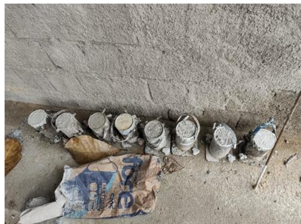
Ensaio de resistência a compressão simples-concreto.