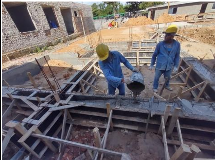
Lançamento com uso de baldes, adensamento e acabamento de concreto em estruturas.