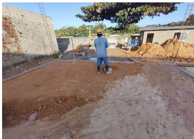
Argila, (Retirada na Jazida, sem transporte)