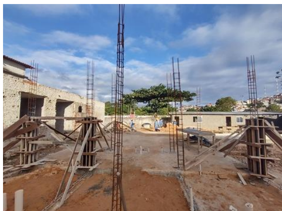
Montagem e desmontagem de fôrma de pilares retangulares e estruturas similares, pé direito simples, em chapa de madeira.