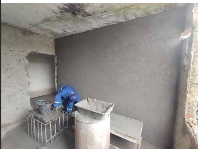
Serviço de emboço/Massa única, em paredes internas.